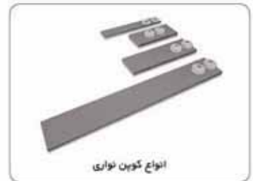
انواع کوپن نواری

کوپن‌های نواری برنا الکترونیک از پرکاربردترین انواع کوپن‌ها می‌باشند. این کوپن‌ها دارای دو حفره بوده و به همراه واشرهای عایق کننده جهت نصب عرضه می‌شوند. مشخصات کوپن‌های استاندارد برنا الکترونیک به همراه کدهای مربوطه در جدول ضمیمه آورده شده‌است.