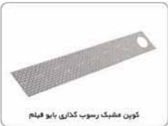
کوپن مشبک رسوب گذاری بایو فیلم

کوپن‌های مشبک رسوب‌گذاری بایو فیلم برنا الکترونیک جهت تعیین کمی یا شناسایی میکروارگانیسم‌ها استفاده می‌شوند. این کوپن‌ها با استفاده از مش فولاد زنگ نزن مقاوم به خوردگی ساخته می‌شوند و سطحی ایده آل برای رشد بایو فیلم مهیا می‌سازند. این کوپن ها بیشتر در مخازن آب مورد استفاده قرار می‌گیرند.