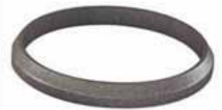
کوپن خوردگی حلقوی فولادی

کوپن‌های حلقوی برنا الکترونیک جهت بررسی اثر محیط‌های سیال حفاری بر لوله حفاری طراحی شده‌اند. این کوپن‌ها اهمیت ویژه‌ای برای محیط‌های حاوی گاز ترش، سیال‌های حاوی اکسیژن و آب شور دارند. حلقه‌های خوردگی از فولادی با